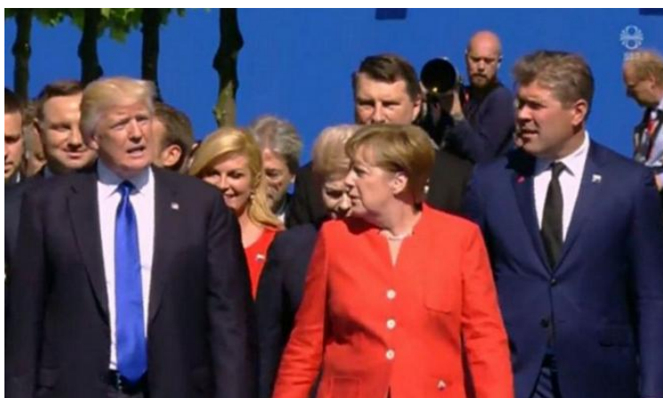
Donald, Angela et Bjarni à Bruxelles

Commençons notre chronique par cette question, essentielle, à laquelle la photo ci-contre apporte une réponse, où l'Union Européenne et l'Islande, côte à côte, regardent inquiets vers l'Amérique...qui regarde ailleurs !