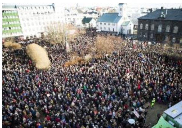
« Elections maintenant !!! »