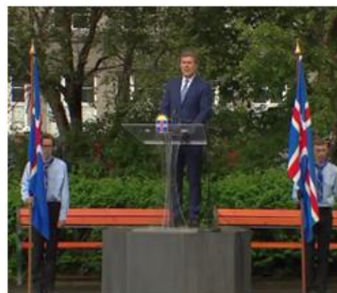
Góðir landsmenn !

Le 17 juin est jour de fête nationale. Traditionnellement le Premier Ministre fait un discours devant un auditoire dont la dimension est déterminée par la météo. Cette fois Bjarni Benediktsson se montre résolument optimiste, non seulement pour son pays mais aussi pour le monde 2 : « nous sommes parmi ces pays nordiques qui ont réussi à créer des sociétés meilleures et plus justes que celles qui existaient auparavant. Ceux qui étaient présents lorsque la république a été proclamée [17 juin 1944] peuvent être fiers des résultats obtenus (...). Dans le monde, le revenu moyen des populations a plus que triplé depuis la guerre, elles ont consommé un tiers de calories en plus, la mortalité infantile s'est réduite de deux tiers (...). Pourtant le message politique le plus souvent entendu est que notre société se détériore. C'est qu'il nous reste beaucoup à faire... »