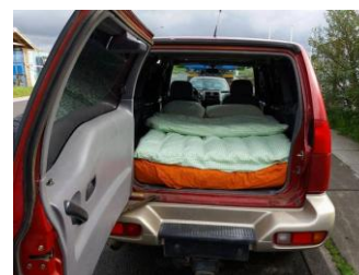
20€ la nuit...