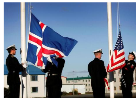
2006 : en dépit de ses engagements l'armée américaine quitte Keflavík