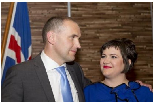
Eliza et Guðni

Le sixième président islandais, qui le 1 er août prendra une place occupée pendant 20 ans par Ólafur Ragnar Grímsson, est un universitaire de 48 ans, né à Reykjavík, qui a fait des études d'histoire et de sciences politiques en Islande et en Grande Bretagne (Warwick puis Oxford) ; il enseigne aujourd'hui à l'Université d'Islande.