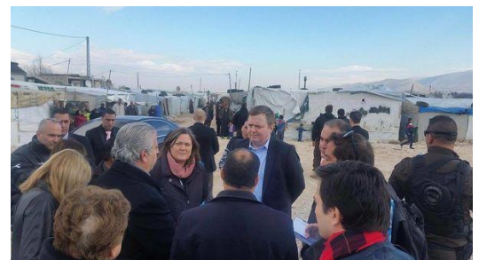
Le Premier Ministre au camp de Zahle

Le 4 février Sigmundur Davíð Gunnlaugsson participe au sommet de Londres sur les réfugiés syriens et des pays limitrophes. Auparavant il a passé 3 jours au Liban afin de se faire une opinion précise sur la situation.