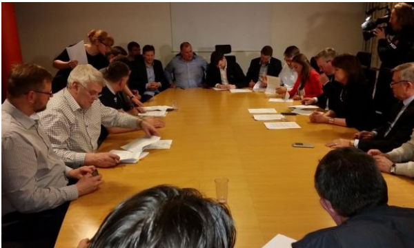
beaucoup de monde autour du Médiateur

Depuis le 14 décembre 2016 plus un bateau ne pêchait hormis les très petits, au point que le tonnage capturé en janvier atteignait à peine 10% de ce qu'il avait été en janvier 2016. Les dommages pour l'économie étaient énormes et personne hormis les pêcheurs ne comprenait bien l'importance de faire durer ce conflit pour un problème apparent de fiscalisation ou non d'une indemnité de repas.