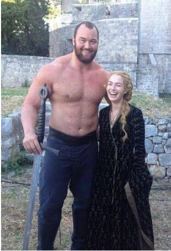
La Montagne et la Reine Lena Headey

17.04 – Kim Kardashian et Kanye West arrivent en Islande et vont y passer 3 jours,