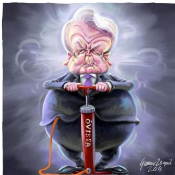
« óvissa » = incertitude

Après un exceptionnel emballement, qui me conduit à la rédaction d'un numéro spécial « mars 2 », très mal nommé puisque j'y relate des événements intervenus début avril, la vie politique semble vouloir reprendre son souffle... Paradoxalement la relance vient de celui-ci même qui avait su calmer le jeu, apparemment ! Satisfait de son action le président Ólafur Ragnar Grímsson se dit néanmoins inquiet de l'avenir, en déduit que le pays a encore besoin de sa protection et annonce sa candidature pour un sixième mandat ! Pendant ce temps le nouveau gouvernement se remet au travail et promet des élections lorsqu'il aura réalisé son programme, donc seulement si l'opposition se montre conciliante ! Retour dans l'ornière ? ou sur l'Austurvöllur ?