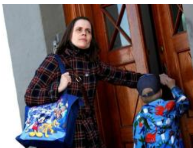
Katrín entre dans les bureaux du gouvernement – déjà ?

Les électeurs s'impatientent : selon un sondage (Maskina) du 8 avril, 50.7% d'entre eux voudraient des élections au printemps, mais il est très improbable qu'ils soient satisfaits. S'ils l'étaient 34% d'entre eux voteraient pour les Pirates, 21.3% pour le Parti de l'Indépendance, 20% pour la Gauche Verte, 9.4% pour le Parti du Progrès, 7.2% l'Alliance Social-démocrate, et 5.2% pour Avenir Radieux.